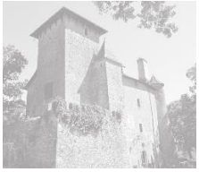
Château de Charmes Samedi & Dimanche 14h00 – 18h00

Circuit patrimoine fléché dans les ruelles Visite libre au départ de la mairie