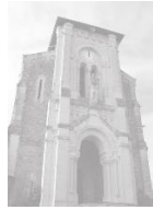
Eglise paroissiale Samedi 14h – 17h00 Dimanche 14h – 15h30

Causerie Botanique : Dimanche à 16h00 au village salle Charles Robert