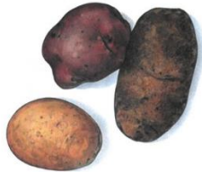
Une causerie-spectacle d'Yves YGER